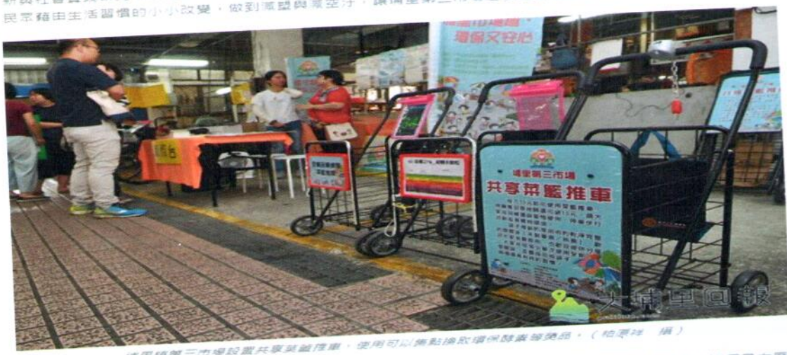
埔里鎮第三市場設置共享菜籃推車，使用可以集點換取環保酵素等禮品。

【葉蔚穎、柏原祥／埔里報導】為了更友善的市場，你願不願意忍受一時小小的不便呢？暨南國際大學人文創新與社會實踐研究中心與各個市場管理單位、協會、攤商共同合作，推動友善市場行動集點換好禮活動，鼓勵民眾藉由生活習慣的小小改變，做到減塑與減空汙，讓埔里第三市場逐步的成為綠色市場。