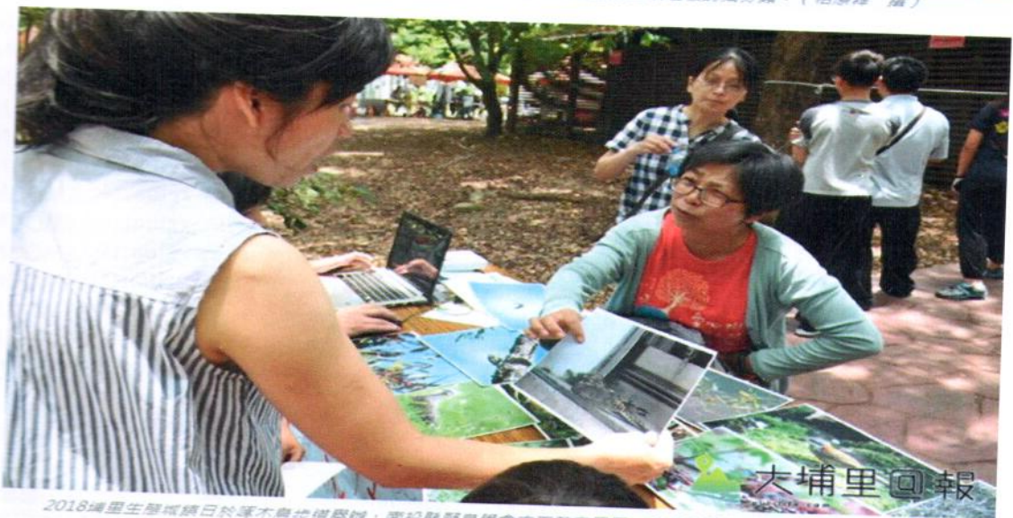
2018埔里生態城鎮日於潭木角步道舉辦，南投縣野鳥學會志工教居民眾，如何辨識會分神鳥類。