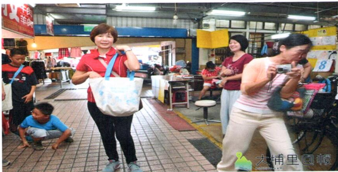
埔里鎮第三市場推動友善市場行動計畫，只要騎乘非機動車或步行購物、提、推菜籃、使用環保購物袋，即能集點換取禮物。

暨大人社中心指出，環保酵素清潔劑由埔里環保酵素團贊助，可用於洗碗、洗地、洗馬桶等，酵素可分解有害微生物與化學物質，取代化學清潔劑，減少水質污染；埔里市場道環保袋針對此次友善行動而設計，目的是用大型購物袋做為外袋使用，減少索取全新塑膠袋，蔬果可以直接裸裝，或是裝入乾淨塑膠袋，保鮮盒做分裝；輕便推車是鼓勵民眾將汽機車停放至停車場（格），拉著輕便推車悠閒慢步購物，才能緩緩品味第三市場豐富多元的在地特色，並讓市場空氣更清新。