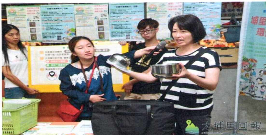
埔里鎮第三市場推動友善市場行動計畫，只要騎乘非機動車或步行購物、提、推菜籃、使用環保購物袋或使用非一次性容器，即能集點換取禮物。

暨大人社中心指出，環保酵素清潔劑由埔里環保酵素團贊助，可用於洗碗、洗地、洗馬桶等，酵素可分解有害微生物與化學物質，取代化學清潔劑，減少水質污染；埔里市場道環保袋針對此次友善行動而設計，目的是用大型購物袋做為外袋使用，減少索取全新塑膠袋，蔬果可以直接裸裝，或是裝入乾淨塑膠袋，保鮮盒做分裝；輕便推車是鼓勵民眾將汽機車停放至停車場（格），拉著輕便推車悠閒慢步購物，才能緩緩品味第三市場豐富多元的在地特色，並讓市場空氣更清新。