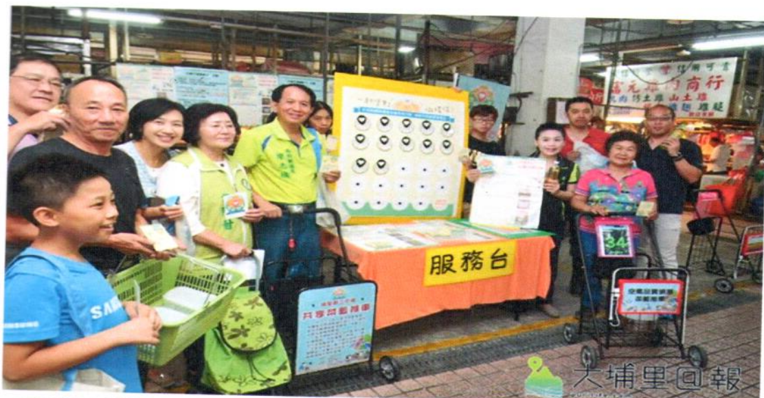
埔里鎮第三市場推動友善市場行動計畫，只要騎乘非機動車或步行購物、提、推菜籃、使用環保購物袋或使用非一次性器具，即能集點換取禮物。