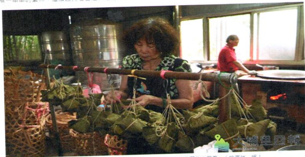
埔里阿嬤帶領良願堂的志工料理素粽，迄今仍以大灶燒著柴火蒸著。

【柏原祥／埔里報導】埔里陳網阿嬤帶領志工料理的「良願堂素粽」，已有40年的歷史，阿嬤輔導兒童、青少年向善的社會福利志業，早期靠著一顆一顆素粽奠定而基礎，40年後，良願堂換了新的大灶，柴火依然炙熱，蒸煮一串串的素粽，繼續護持著曾走入迷途的少年。