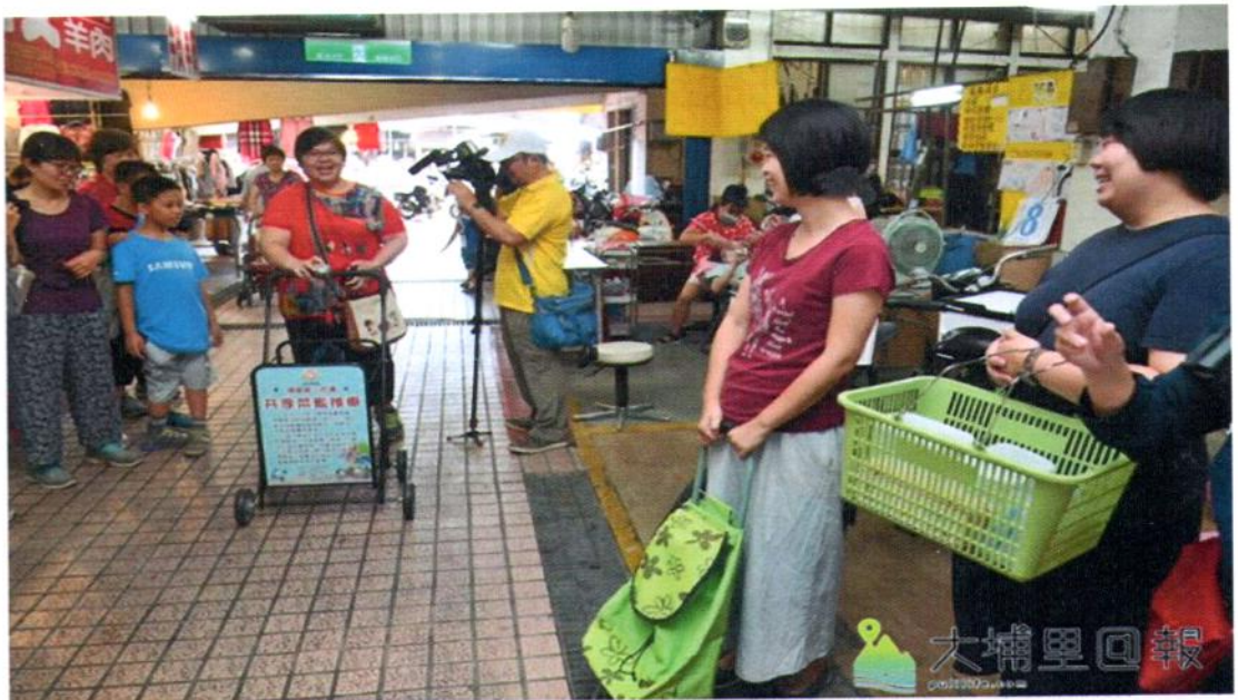
埔里鎮第三市場推動友善市場行動計畫，只要騎乘非機動車或步行購物、提、推菜籃，即能集點換取禮物。

從2018年6月9日至6月29日，友善市場行動集點換好禮活動啟動，只要民眾「自備或使用非一次性餐具、容器、袋子」、「使用低碳載具（騎腳踏車與電動車）」、「停車步行購物」、「使用菜籃或菜籃推車」、「使用埔里市場環保袋」，活動期間，如集滿10點可兌換「環保酵素清潔劑」、25點可兌換「埔里市場環保袋」、75點可兌換「輕便推車」。