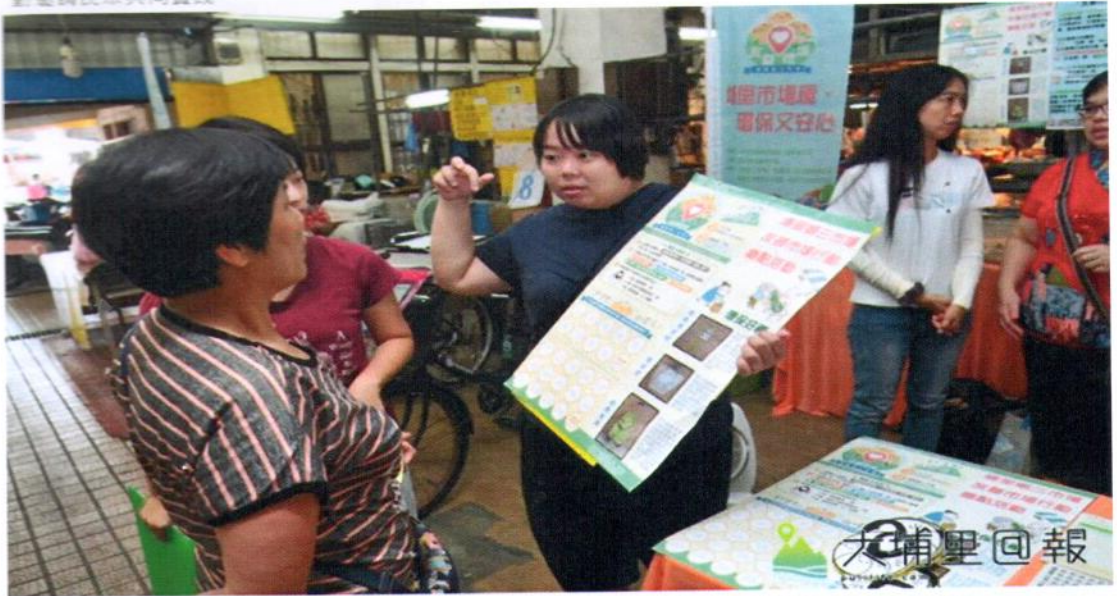
埔里鎮第三市場推動友善環境計畫，志工說明友善行動集點換取禮物辦法。（柏原祥 攝）

如何提升運送及貯存清新、整齊乾淨、人潮絡繹不絕的市場競爭力呢？暨大人社中心結合埔里鎮公所自治事業輔導系、第三公海粵東市場（南投縣埔里鎮公有第三市場自治委員會）、南門三市（南投縣埔里鎮攤商協進會）、光十二攤茶區（埔里鎮茶商協進會）以及攤商們的力量，啟動「埔里第三市場友善環境實驗計畫」，目前正階段性完成問卷，瞭解民眾實際需求，下一步就是透過環境教育宣導提升環境意識，並持續辦理相關活動邀請民眾共同實踐。