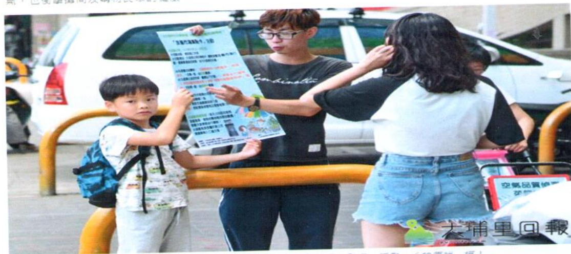
志工高傑看板，向第三市場民眾推廣「友善市場集點卡」活動。

埔里鎮第三市場是埔里最熱鬧的市場，卻也是空氣最污濁、交通最混亂的市場，長久以來，埔里鎮公所未積極落實管理，管控汽機車入內，不僅人車爭道的情形屢見不鮮，民眾騎機車買菜、攤商進出貨車所產生的廢氣，也衝擊攤商及購物民眾的健康。