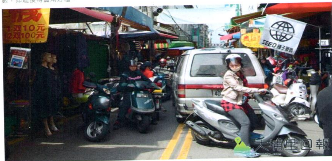
第三市場長久未落實人車分離，不僅交通混亂，空氣也很污濁。

【柏原祥／埔里報導】為打造交通順暢、空氣清新的友善市場，暨南大學水沙連人文創新與社會實踐研究中心在埔里鎮第三市場進行綠色生活實踐計畫，從9日開始，只要自備非一次性餐具或使用菜籃或推車，蓋章集點數，即能獲得實用好禮。