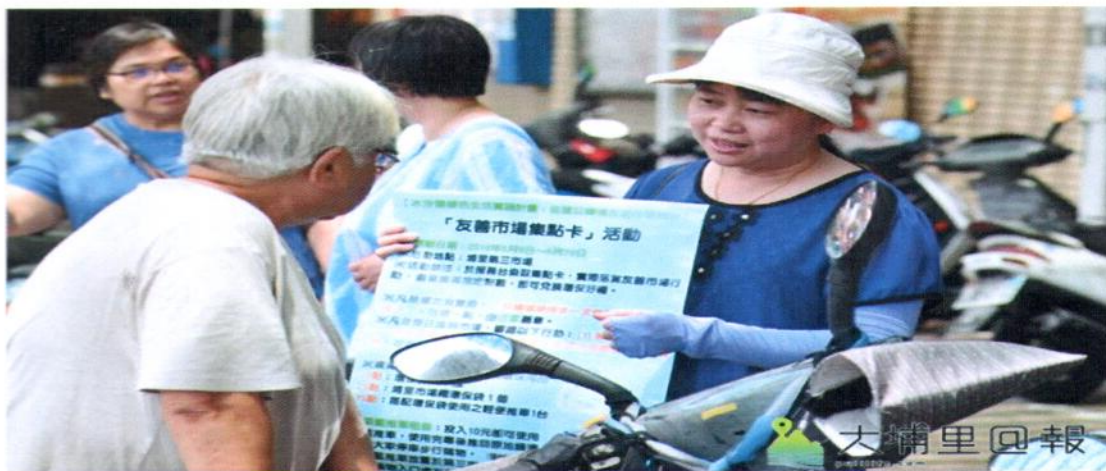
志工拿著看板，向第三市場買菜民眾推廣「友善市場集點卡」活動。

暨大人社中心推動「水沙連綠色生活實踐計畫」，試圖建立環境友善市場，選擇第三市場做為推動的場域，先前已做過調查問卷，絕大多數民眾認為第三市場人車爭道問題的確造成困擾，空氣也很污濁，希望能改善，也期望動線設計更順暢，並做車輛管制，如此會有更多人願意以步行購物。