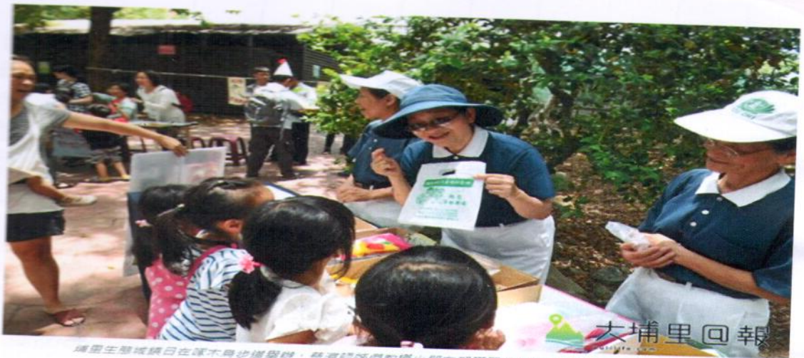
埔里生態城鎮日在潭木角步道舉辦，慈濟師姊們教導小朋友有關回收垃圾的紙分類。