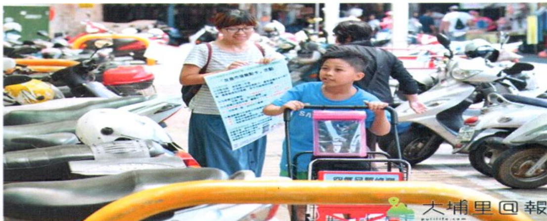
志工推著空菜籃與偵測空氣推車，向第三市場民眾推廣「友善市場集點卡」活動。

志工近幾個假日齊聚在第三市場建物入口，並帶來空汙品質監測菜籃推車，用實際數據告知消費者，市場空汙與汽機車有連帶關係，並預告「友善市場集點卡」活動，志工指出，從9日至29日，凡是單次消費自備或使用非一次性餐具、容器、袋子，停車步行購物或用菜籃、推車可向特約攤商集點，集滿點數可獲得環保酵素，埔里市場送環保袋或搭配輕便推車一台，而市場也提供10元押金菜籃推車，創造誘因，鼓勵大家停車步行購物。