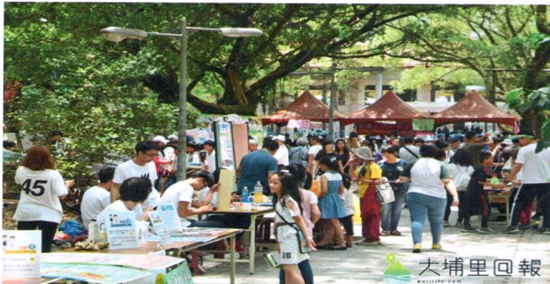
2018埔里生態城鎮日於陳木身步道舉辦，今年不僅辦園遊會，還設計了行動記錄卡，讓友善環境與生活的力量持續。

【柏原祥 / 埔里報導】2018埔里生態城鎮日在埔里鎮陳木身步道登場，36個攤位，展現對於埔里宜居城鎮的努力與想像，主辦單位另設計了行動記錄卡，要讓愛城鎮、愛土地的力量在園遊會活動後持續增溫，藉由每個人小小的改變，讓埔里鎮變得更好。